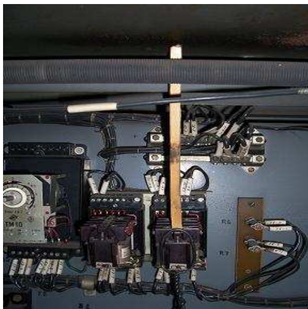
Příloha 2. g): Hlavní rozvodna v rozporu s projektovou dokumentací 2008.