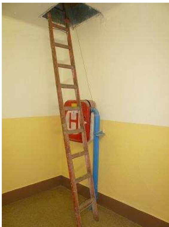
Příloha 2. b): Nepřístupný nástěnný hydrantový systém [10].