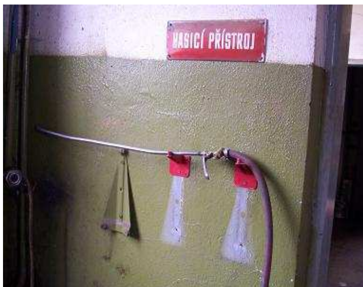
Příloha 2. f): Zneužití držáků přenosných hasicích přístrojů, foto D. Petrželka 2008.