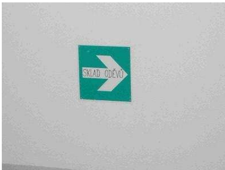
Příloha 2. e): Zneužití značky informující o směru úniku osob z objektu (otočení proti směru úniku a znehodnocení nápisem sklad oděvů) [10].