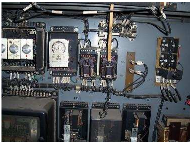
Příloha 2. h): Hlavní rozvodna v rozporu s projektovou dokumentací, foto D. Petrželka 2008.