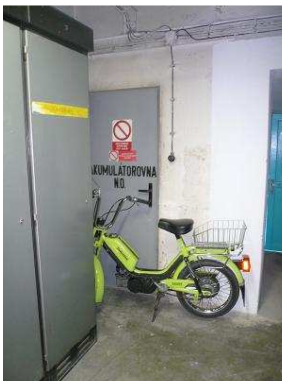
Příloha 2. d): Zatarasený přístup do prostoru akumulátorovny a využívání prostor hlavní rozvodny v rozporu s projektovou dokumentací [10].