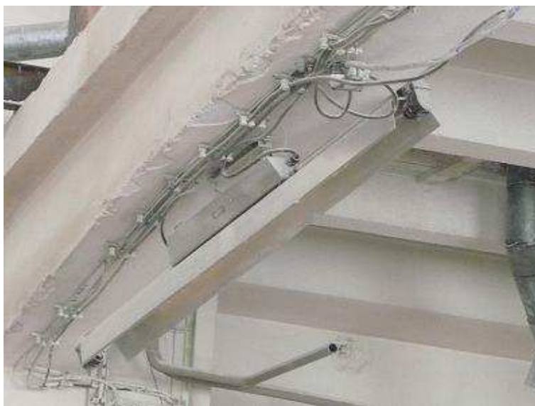
Příloha 2. a): Nevyhovující stav elektroinstalace na pracovišti s výskytem hořlavých prachů [10].